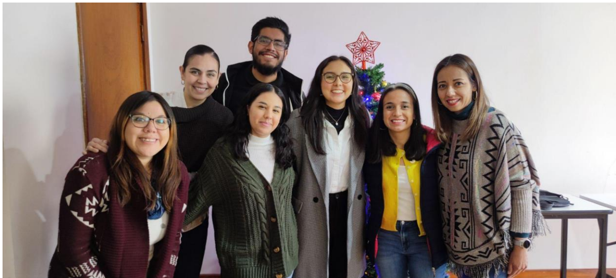
Figura 10. Equipo de Ra Ké y ProSociedad

Fuente: Fotografía tomada por el equipo de ProSociedad el 11 de diciembre de 2023