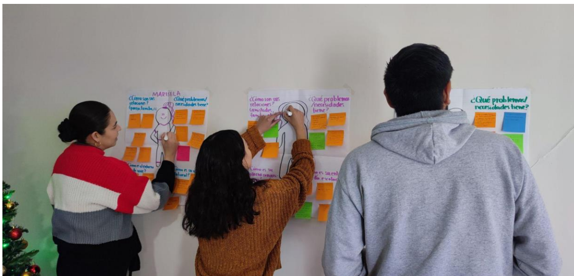
Figura 2. Día 1- Taller Validación diagnóstico del problema y focalización de la población