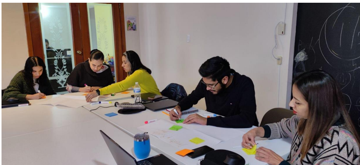
Figura 3. Día 2- Taller Actualización de la Teoría del Cambio