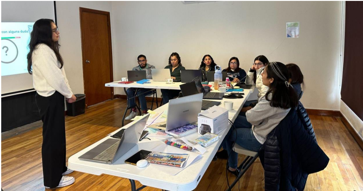
Figura 8. Taller de documentación de procesos