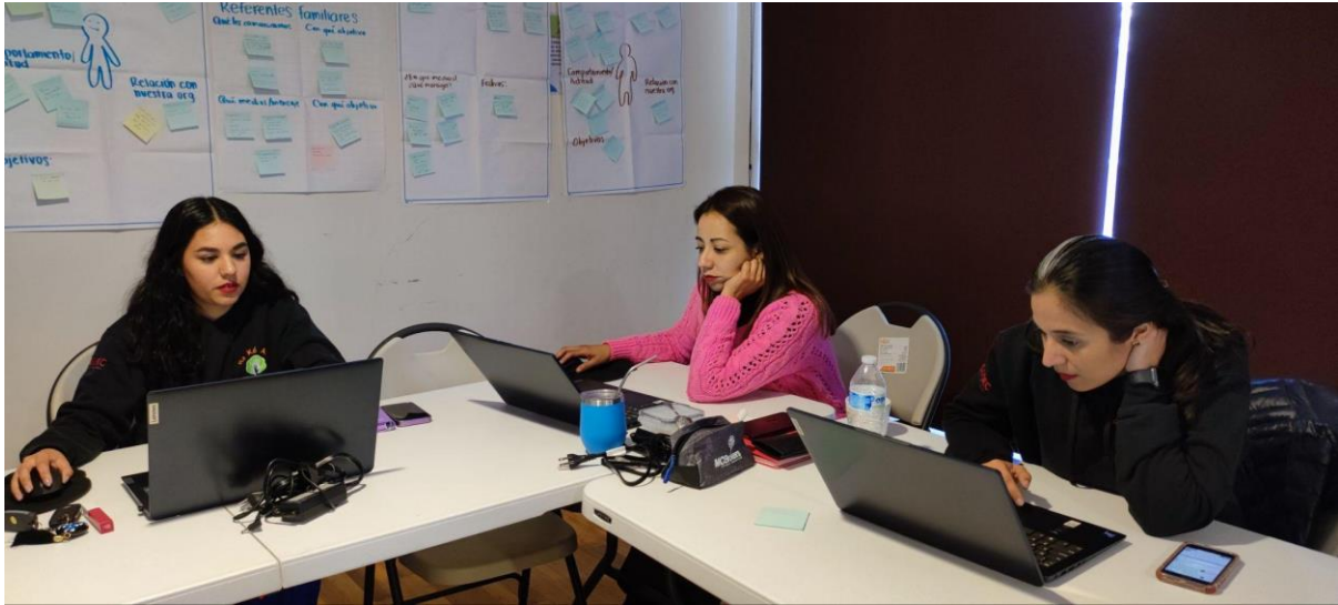
Figura 9. Taller de creación del Plan de Evaluación de Desempeño