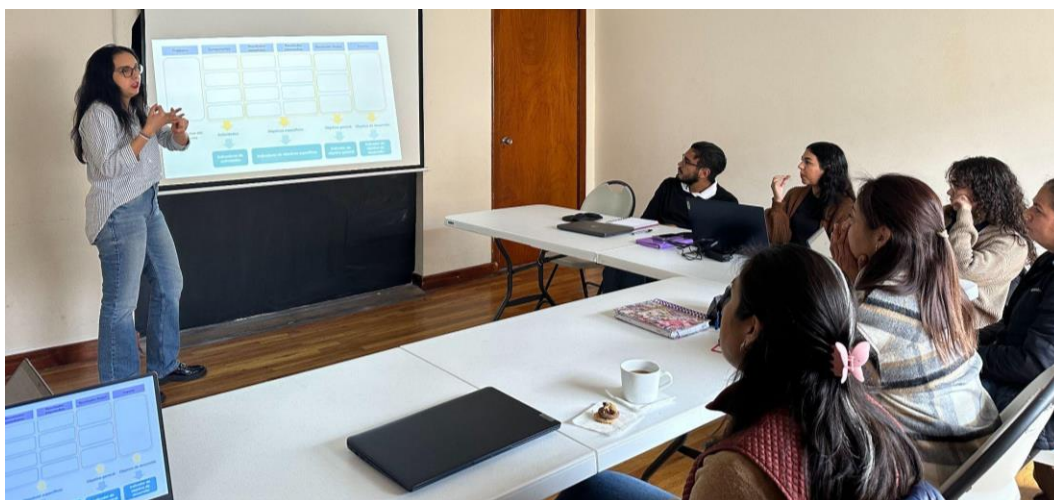
Figura 4. Taller para la validación del Sistema de Monitoreo y Evaluación