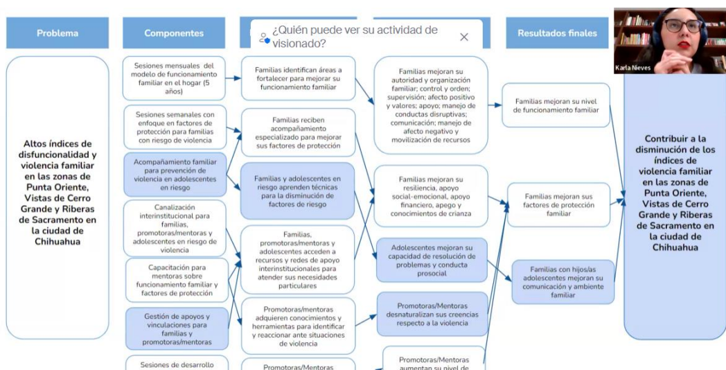
Figura 2. Sesión de validación de la Teoría del Cambio y Objetivos