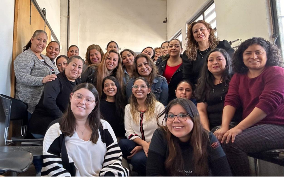
Figura 7. Equipo de COFAM y ProSociedad