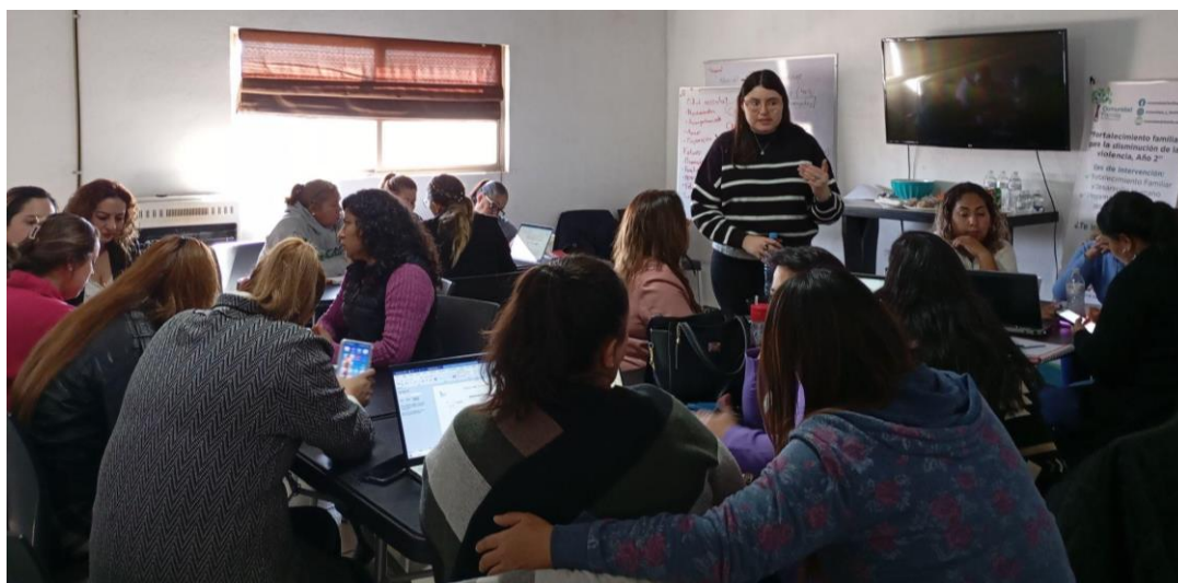
Figura 4. Taller presencial para la revisión de insumos operativos (día 1)