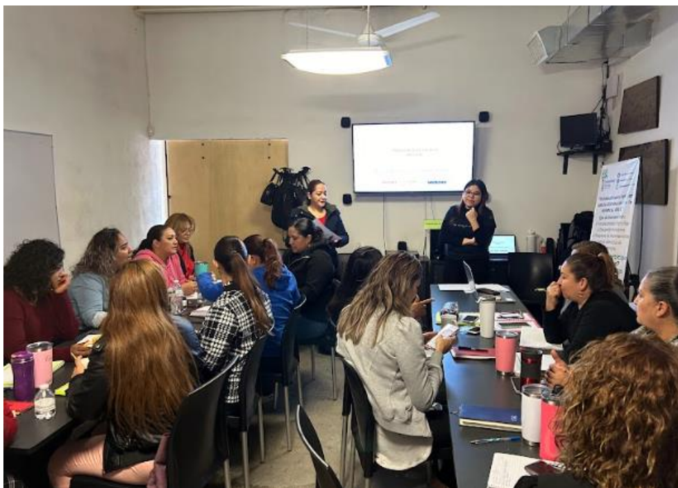
Figura 6. Actividades de documentación de procesos con el equipo operativo