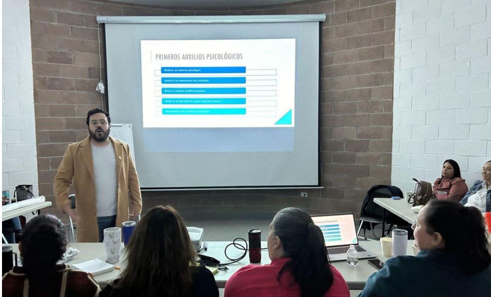
Figura 5. Taller de sensibilización al personal operativo sobre manejo de situaciones de riesgo y validación del protocolo de actuación en casos de riesgos.