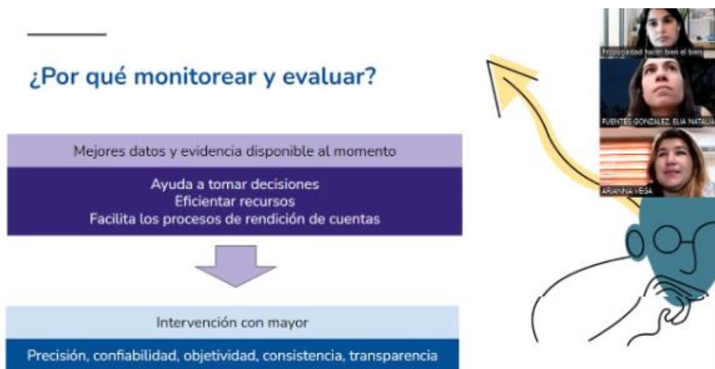
Figura 5. Taller de creación del sistema de Monitoreo y Evaluación virtual