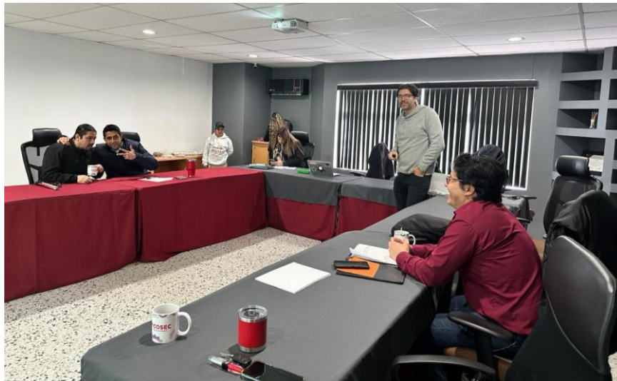
Figura 7. Taller de Desarrollo de Guías Terapéuticas